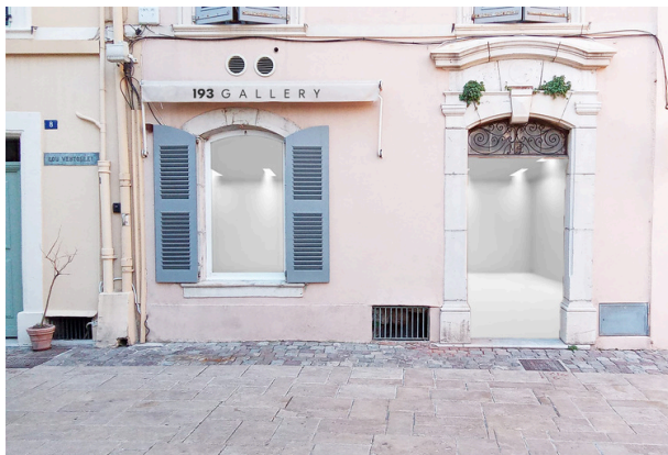
Façade de 193 Gallery Saint Tropez, 6 rue du Cépoun San Martin, Saint-Tropez